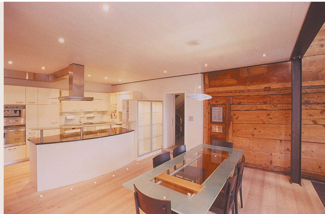
Das 180 Jahre alte Haus der Grosseltern, in dem sich heute die Ausstellung für Küchen und Möbel befindet, wurde völlig entkernt. Zum Vorschein kamen beim Umbau in den zwei hohen, offenen Geschossen dann faszinierende Bohlenwände.

Nach Angaben des Verbandes der Schweizer Möbelindustrie sind im vergangenen Jahr für 3,6 Milliarden Franken Wohnrichtungen verkauft worden, inklusive Heimtextilien und Lampen. Das war gegenüber 2002 ein Minus von 4,3 Prozent. Im